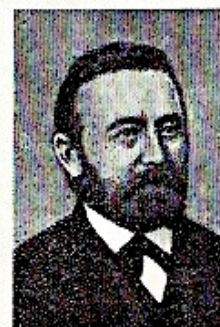
Mejeriets første Bestyrelse: